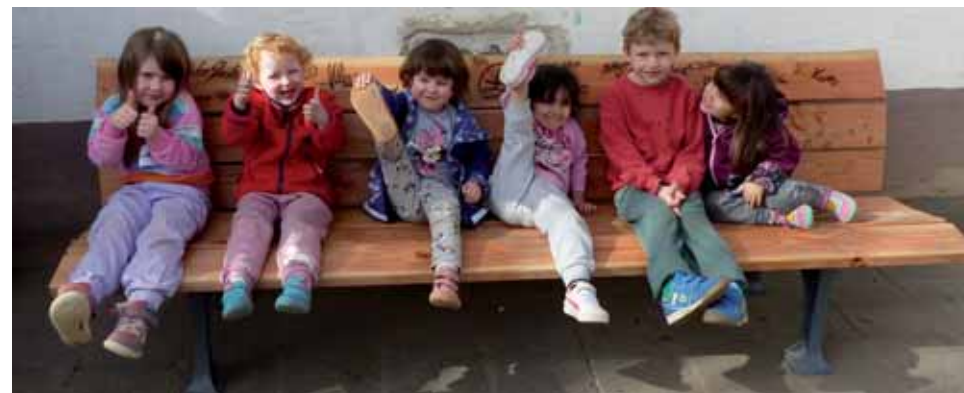
Ob Daumen hoch oder Fuß in die Luft, wir sagen: „Die Bank ist klasse!“

Änderungen vorbehalten. Es können sich immer wieder Änderungen ergeben. Schauen Sie hierzu auch auf der Homepage www.luther-la.de oder melden Sie sich zu unserem Lutherletter an.