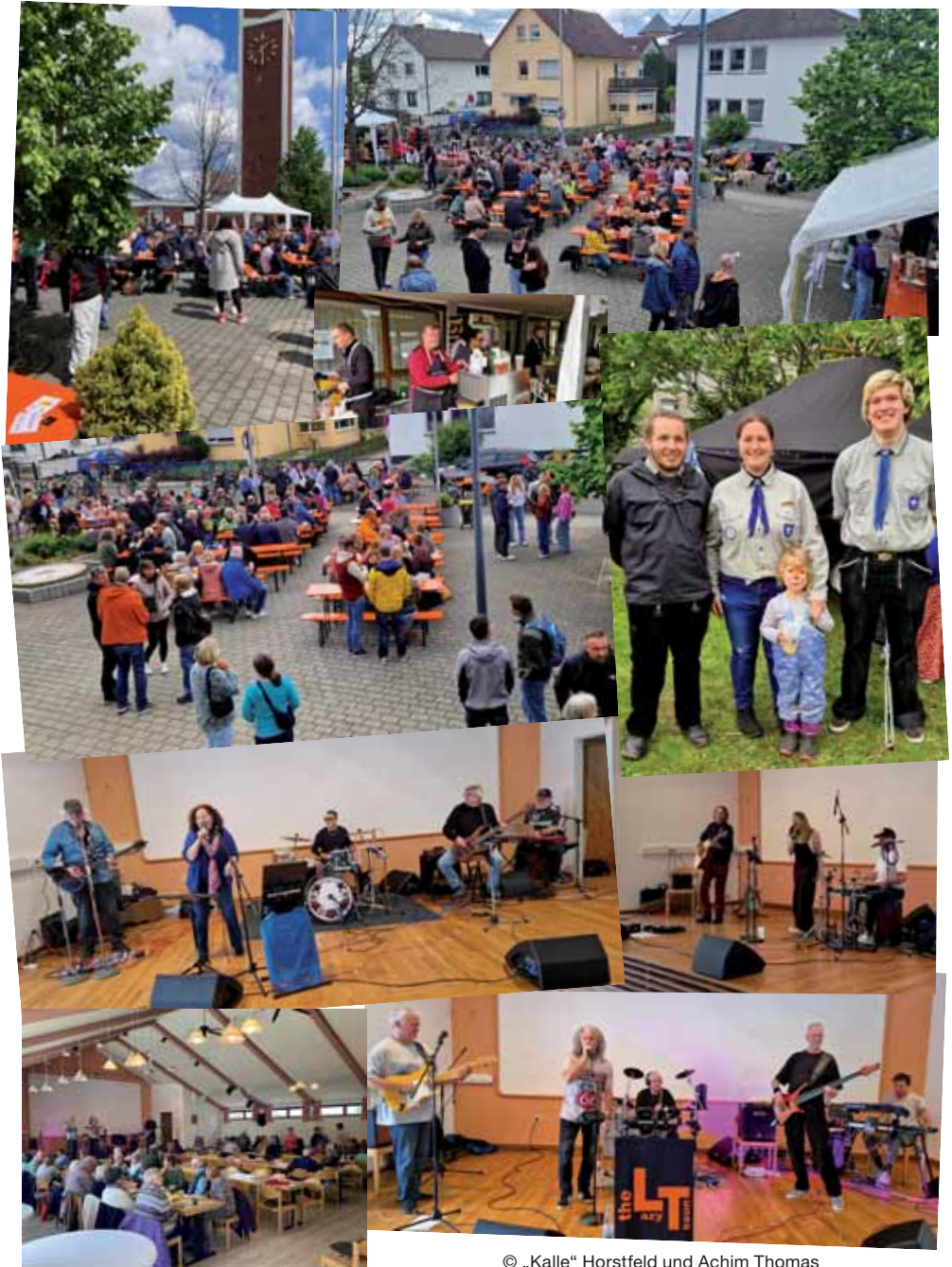
© „Kalle“ Horstfeld und Achim Thomas